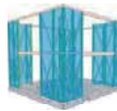
***** 住宅性能評価7項目 最高等級クリア

長期優良住宅の認定基準には、等級(耐震2・劣化対策3・維持管理3・省エネ4)という住宅性能があります。Vintage houseはこの認定基準に加え、将来住まい方が変わっても容易にリフォームできる“可変性”も備えています。これは、住宅の長期利用には重要な性能で、構造の外まわりは頑丈で長持ちするように、内部は自由に変更できるようにするものです。また、建物の4隅に耐力壁をバランスよく配置することで地震時の建物のねじれを抑えることができ耐震性・耐久性も備わっています。さらに、住宅性能評価基準の“7項目”においても最高等級だから100年住み継がれる家可以实现できるのです。