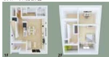
モデルハウス間取り図

「今のわたしには、そんな大きな家はほらない」 「家族みんなが心地よく暮らせるちょうどいい 広さの家」「シンプルなお生活。身軽なお生活。大 事なものを再発見するお生活。」そんなあなたに “Fit (フィット) した 48プラン”をご用意しました。